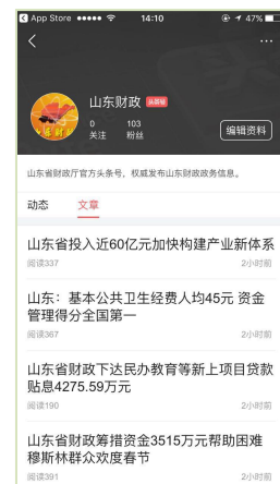
《人民日报》《今日头条》客户端