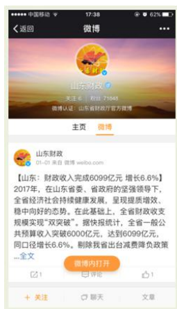
山东财政政务微博

3. 政务微博微信。 自开通“两微一端”以来，累积发布新闻 20392 条，得到广大网民的信任和点赞，做到了“财政故事天天讲，政府形象日日新”。